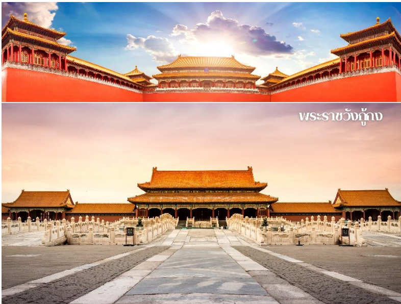
พระราชวังกู้กง

นำท่านชมพระราชวังกู้กง หรือพระราชวังต้องห้าม ตั้งอยู่ด้านหลังจัตุรัสเทียนอันเหมิน แผนผังเป็นรูปสี่เหลี่ยมผืนผ้า มีประตูวัง 4 ประตู 4 ทิศ มีพื้นที่ทั้งหมด 724,250 ตารางเมตร มีตำนานน้อยใหญ่ถึง 9,999 ห้องสร้างขึ้นในสมัยจักรพรรดิหยงเล่อแห่งราชวงศ์หมิง ชื่อในภาษาจีนว่า 'กู้กง' หมายถึงพระราชวังเดิม เหตุที่เรียกพระราชวังต้องห้าม เนื่องจากชาวจีนถือคติในการสร้างวังว่า จักรพรรดิเปรียบเสมือนบุตรแห่งสวรรค์ดังนั้นจึงต้องเป็นที่ต้องห้ามสำหรับคนธรรมดาไม่สามารรถล่วงล้ำเข้าไปได้พระราชวังกู้กงเรียกอีกชื่อหนึ่งว่า "พระราชวังต้องห้าม" พระราชวังแห่งนี้เคยเป็นที่ประทับของจักรพรรดิสมัยราชวงศ์หมิงและราชวงศ์ชิงทั้งหมด 24 พระองค์ (ปีคริสต์ศักราช 1368-1911) ปัจจุบันเปิดให้เข้าชมในฐานะ "พิพิธภัณฑ์พระราชวัง" สิ่งก่อสร้างภายในพระราชวังมีความงดงาม