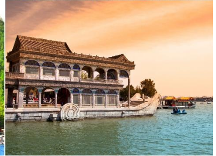
พระราชวังฤดูร้อนอวิ๋เหอหยวน