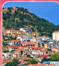
หมู่บ้านชาวประมงซาจื่อไว่