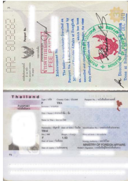
ตัวอย่างการสแกนหนังสือเดินทาง(Passport)

**พาสปอร์ตต้องมีอายุเหลือมากกว่า 180 วัน นับจากวันที่จะเดินทางกลับจากภูฏาน และต้องมีหน้าว่างเหลืออย่างน้อย 2 หน้าติดกัน