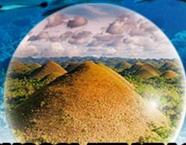
CHOCOLATE HILLS เกาะโมโฮล