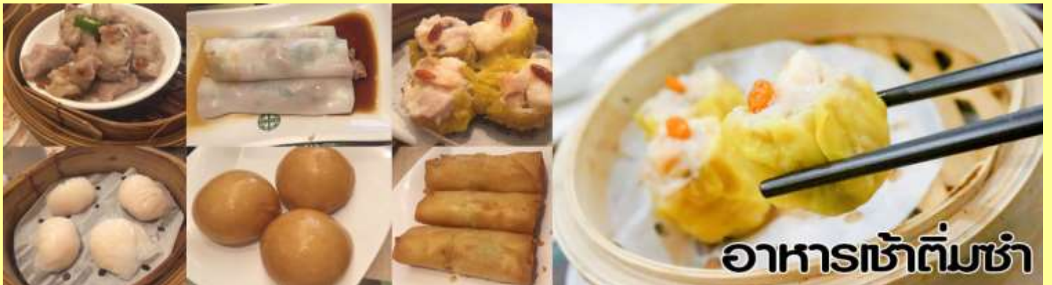
อาหารเช้าติ่มซำ