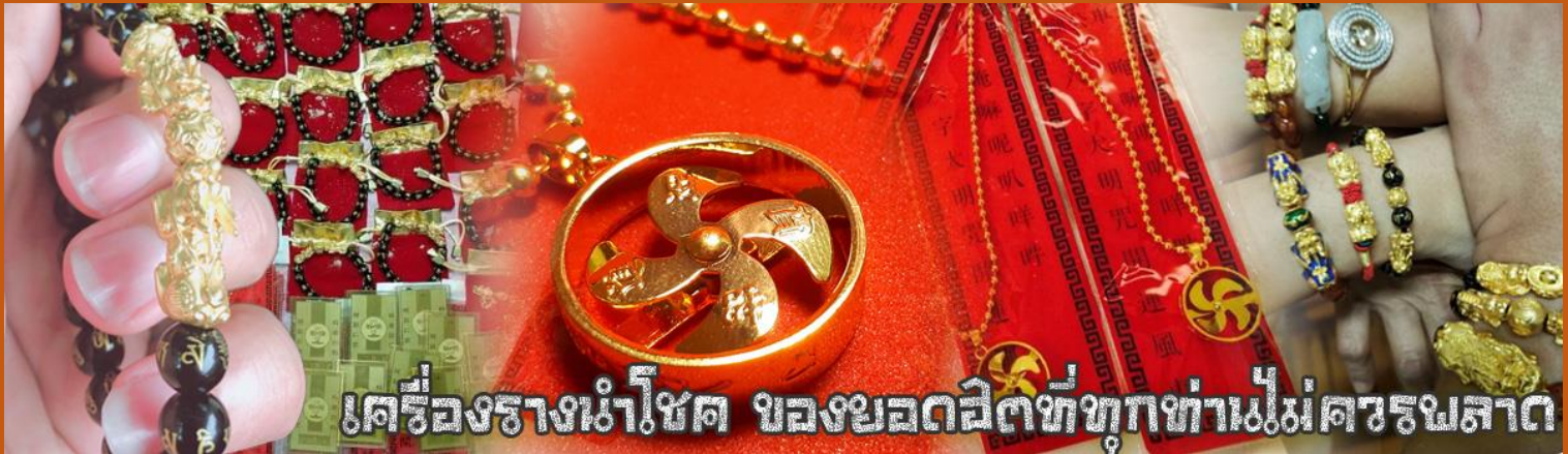
เครื่องรางนำโชค ของขลังสิริมงคลที่ทุกท่านไม่ควรพลาด

จากนั้นนำท่านสู่ ร้านหยก ชมความงามปีเซี่ยะที่เชื่อว่า เป็นวัดคุ้มครองลดยอดนิยม ที่มีการนำมาบูชา เพื่อให้ช่วยป้องกันสิ่งชั่วร้าย เรียกทรัพย์สินเงินทองให้ไหลมาเทมาและกักเก็บทรัพย์นั้นไม่ให้รั่วไหลออกไปไหนได้ ชาวจีนโบราณเชื่อกันว่า ที่เซี่ยะเป็นสัตว์ประหลาดที่รวมลักษณะของสัตว์มงคลทั้ง 5 ชนิดไว้ด้วยกัน ได้แก่ มังกร พญาราชสีห์หรือสิงโต , อินทรี , กวาง และแมว โดยตำนานเล่าว่า ปีเซี่ยะเป็นลูกมังกรตัวที่ 9 (เทพแห่งโชดลาก) ของพญามังกรสวรรค์ มีชื่อเรียกด้วยกันหลายชื่อ ไม่ว่าจะเป็น “เทียนลก” (กวางสวรรค์) เป็นชื่อเดิม ส่วนจีนกวางตุ้งจะเรียกว่า “เผ่เย้า” และคนจีนแต้จิ๋วจะเรียกว่า “ผีชีว”