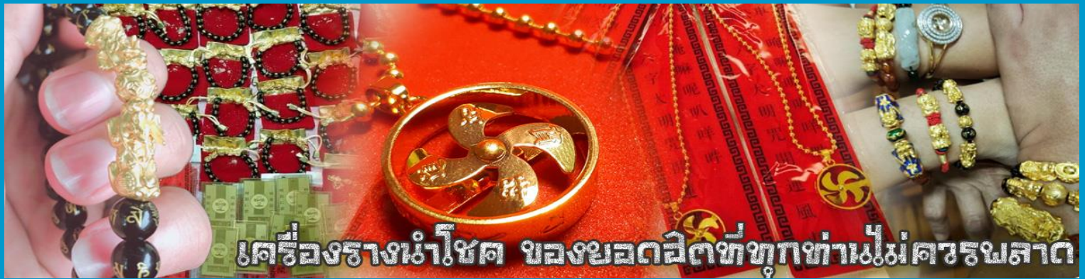
เครื่องรางนำโชค ของยอดฝีมือที่ทุกท่านไม่ควรพลาด

จากนั้นนำท่านสู่ ร้านหยก ชมความงามปีเซียะ ที่เชื่อกันว่าเป็นวัตถุมงคลยอดเยี่ยม ที่มีการนำมาบูชา เพื่อให้ช่วยป้องกันสิ่งชั่วร้าย เรียกทรัพย์สินเงินทองให้ไหลมาเทมา และกักเก็บทรัพย์นั้นไม่ให้รั่วไหลออกไปไหนได้ ชาวจีนโบราณเชื่อกันว่า ปีเซียะเป็นสัตว์ประหลาดที่รวมลักษณะของสัตว์มงคลทั้ง 5 ชนิดไว้ด้วยกัน ได้แก่ มังกร พญาราชสีห์หรือสิงโต, อินทรี, กวาง, และแมว โดยตามตำนานเล่าว่า ปีเซียะเป็นลูกมังกรตัวที่ 9 (เทพแห่งโชคลาภ) ของพญามังกรสวรรค์ มีชื่อเรียกด้วยกันหลายชื่อไม่ว่าจะเป็น “เทียนลก (กวางสวรรค์)” เป็นชื่อเดิม ส่วนจีนกวางตุ้งจะเรียกว่า “เผ่เย้า” และคนจีนแต้จิ๋วจะเรียกว่า “ผิซิว”