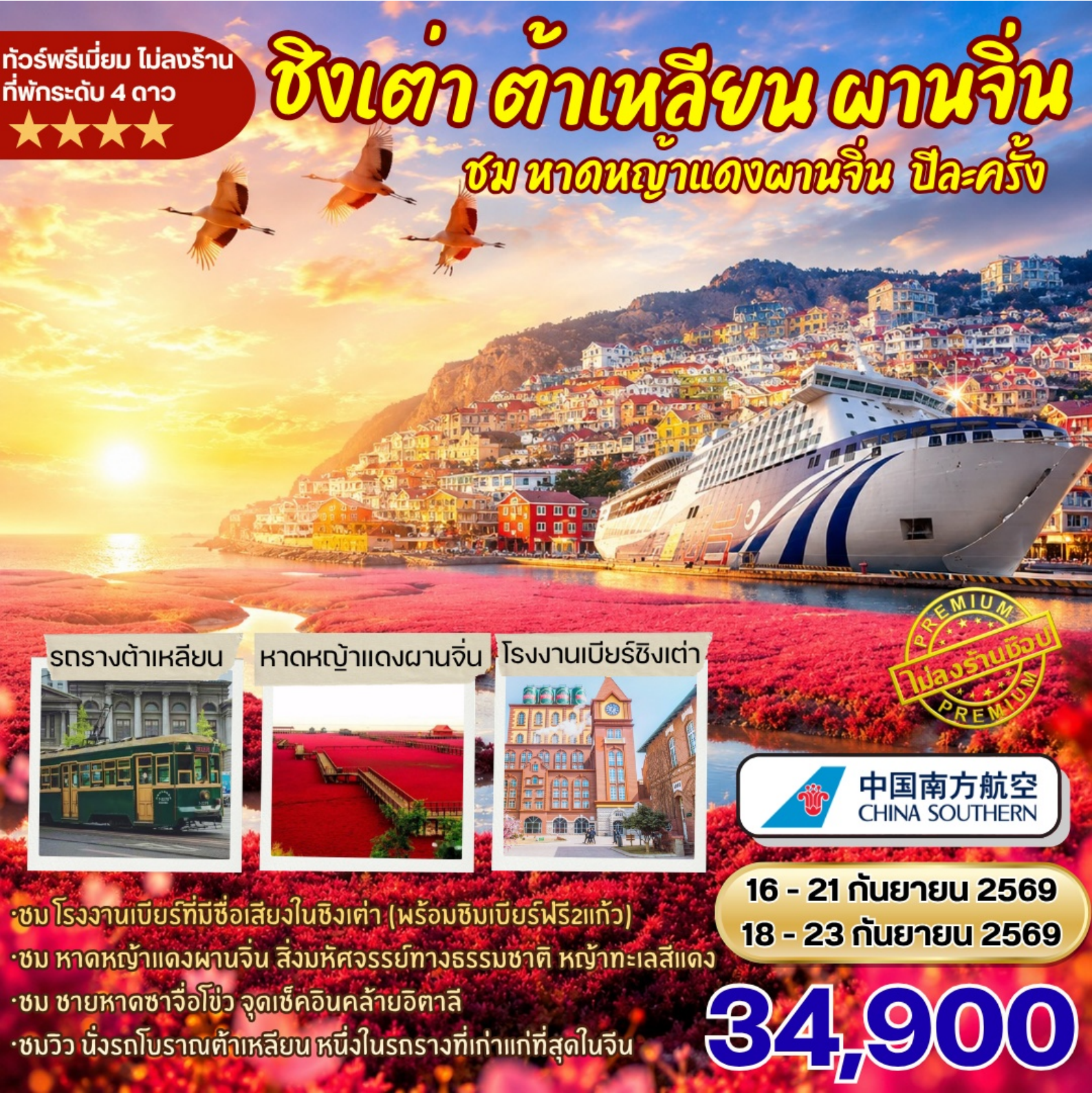
รถรางต้าเหลียน