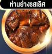
हांอย่างสลิส