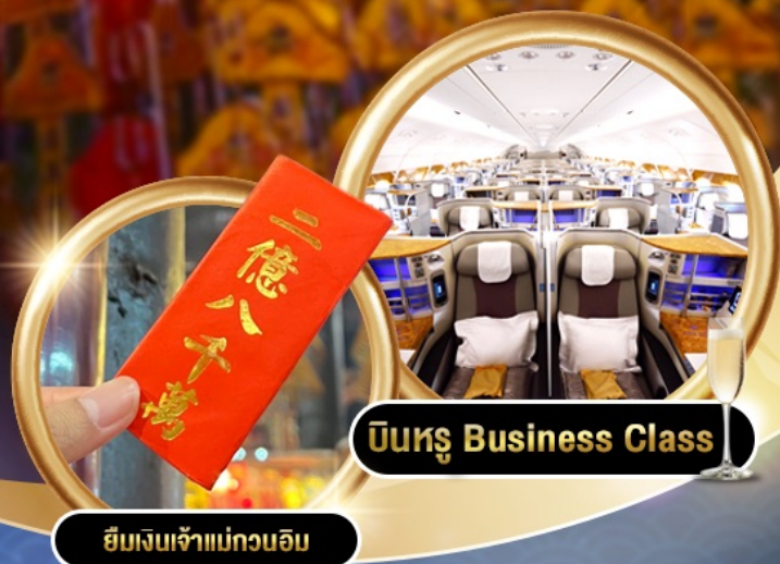
บินหรู Business Class