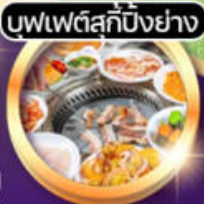
บพเพตลคักบั้งย่าง