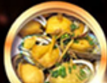
เมนูซีฟู้ดสัญจร