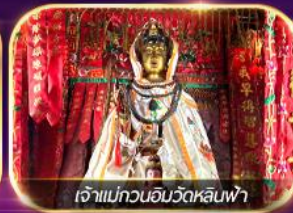
เจ้าแม่ทวนอิมวัดหลินฟ้า

เต็มอิ่มทั้งบุญ และ ซอปปิงแบบจัดเต็ม จิมซาจุ่ย มงก๊ก