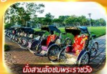
นั่งสามล้อชมพระราชวัง

สัมผัสความสวยงามหมู่บ้านสไตลฝรั่งเศสที่บานาฮิลล์ วัดเทียนมู่ พระราชวังเว้ สัมผัสเมืองโบราณฮอยอัน ล่องเรือกระดิง