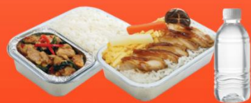
บริการอาหารร้อนบนเครื่อง ชาไป - ชากลับ