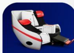
ที่นั่งพรีเมียมแฟลตเบด

บริการอาหารร้อน และ น้ำดื่ม บนเครื่อง ขาไป และ ขากลับ