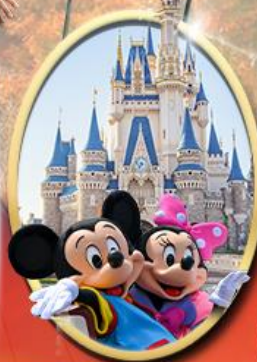
อิสระเลือกซื้อบัตร Tokyo Disneyland