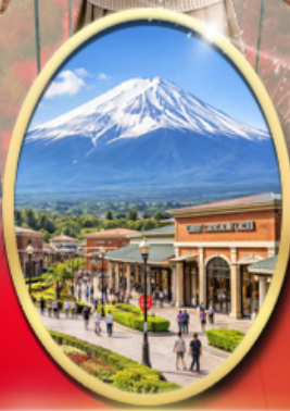
Gotemba Premium Outlets