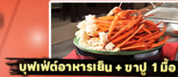
บุฟเฟ่ต์อาหารเย็น + ชาบู 1 มื้อ

บินตรง นาริตะ เครื่องบินลำใหญ่ 370 ที่นั่ง