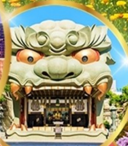
ศาลเจ้าอิมบะ ยาชากะ