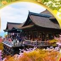
วัดคิโยมิจิ