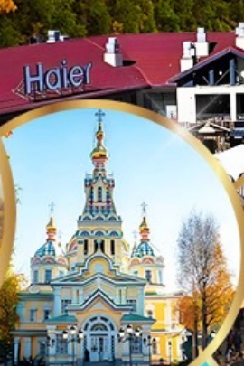
โบสถ์เซนคอฟ