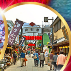
ย่านโบราณ ชิบูมาตะ