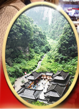
อุทยานหลุมฟ้า สะพาน สวรรค์