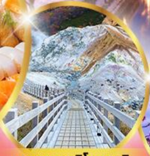
หุบเขานรกจิทอกุตามิ