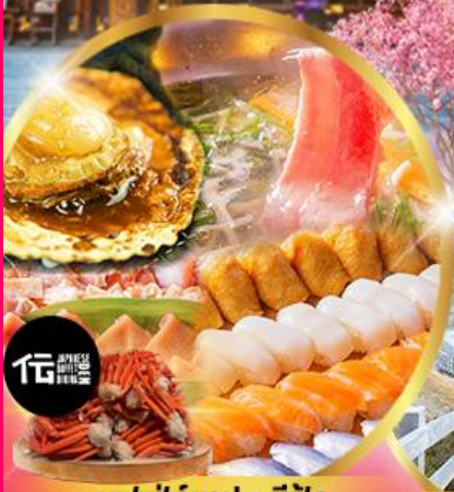
บุฟเฟ่ต์ซาปู + ซีฟุด อาหาร มากกว่า 50 เมนู