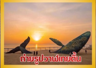
ต่ายรูปวาฬยักษ์ตื่น

สะพานจันเจียว-โบสถ์คาทอลิกชิงเต่า (ชมภายนอก)-ป่าตึกวน- พิพิธภัณฑ์เบียร์ชิงเต่า -ถนนคนเดินโตตง -ผิงไห่เก้อ-ชายหาดและ จุดต่ายรูปปลาวาฬยักษ์ตื่น -ถนนจ้าววีป่าเจีย-ชายหาดลากอเว่ยไห่- จัตุรัสชิงฟู่หมิน-สวนเว่ยไห่ -สวนเยวี่ไห่-เกาะหยางหม่าย่าน - เมือง เก่าเหยียนไถ่-ท่าเรือชาวประมงเหยียนไถ่-ภูเขาเหยียนไถ่-จัตุรัส 54 -ศูนย์ โอลิมปิกเรือใบชิงเต่า-ภูเขาเหล้าซาน-วัดไท่ซิงกง-สวนเสี่ยวม่วยเต่า ชายหาดทะเลหมายเลข 3-อาคารไห่เทียน ชั้น 81- Cyber Punk