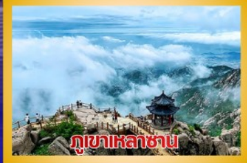
ภูเขาเหล้าซาน