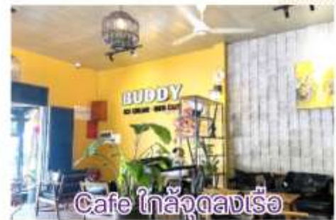
Cafe ไกล่จูดลงเรือ