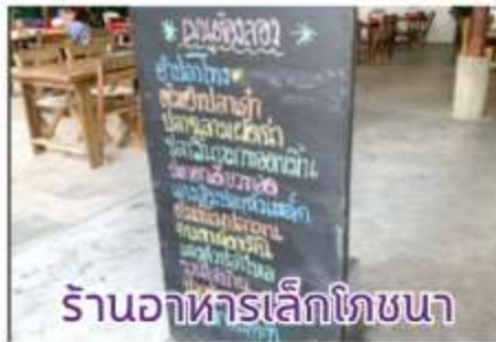
ร้านอาหารเล็กโภชนา