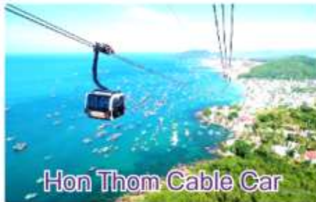
Hon Thom Cable Car