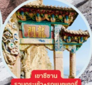
เขาสีซาน รวมกระเช้า+รถแบคเตอร์