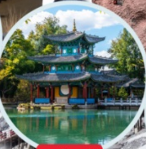
สระมังกรดำ