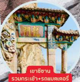
เขาชินชาน รวมกระเช้า+รถแบคเตอร์