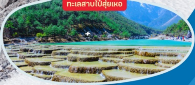
ทะเลสาบไป๋ส่วยเหอ