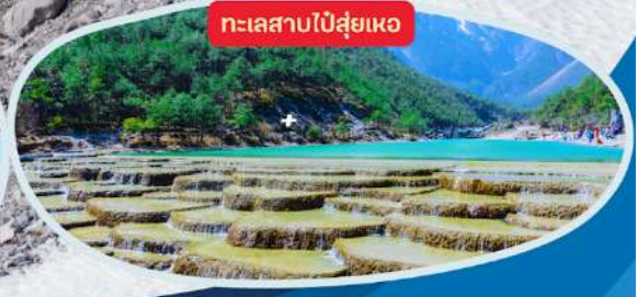
ทะเลสาบไ้ส่วยเหอ