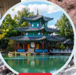
สระมังกรคำ