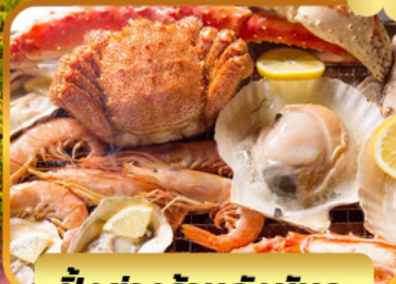
บั้งย่างร้านดังนั้นดะ