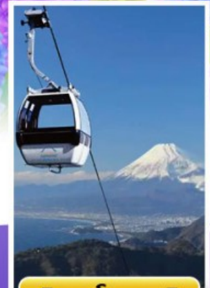
อิซุฟานิรามาวิว