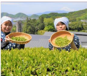
กิจกรรมเก็บชา