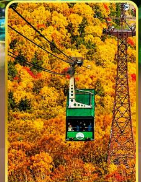
กระเช้าคุโรดากะ