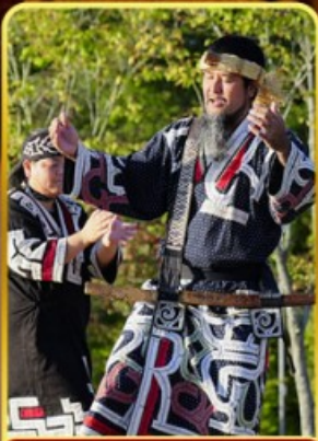
พิพิธภัณฑ์โอนู