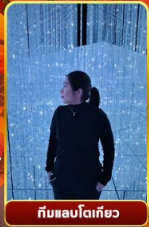
ทีมแอปเปิ้ลโตเกียว