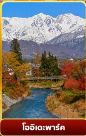
โออิเดะพาร์ค