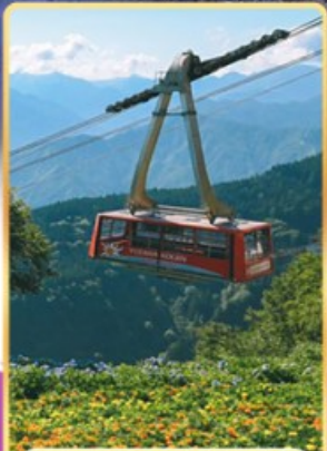
นั่งกระเช้าชูซาว่าโคเอ็น