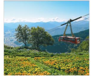
กระเช้าชูชาวาโดเอ็น