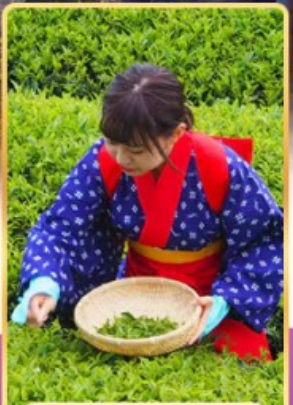
กิจกรรมเก็บชา