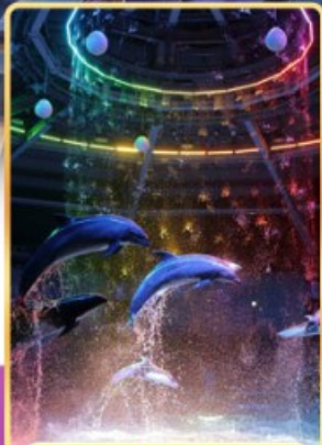
อควาพาร์ค ซินางาวะ