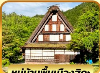
หมู่บ้านพื้นเมืองฮิดะ