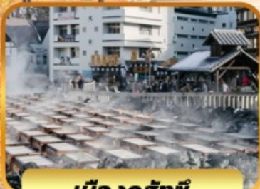
เมืองคุสัทซึ