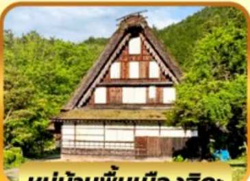
หมู่บ้านพื้นเมืองฮิดะ