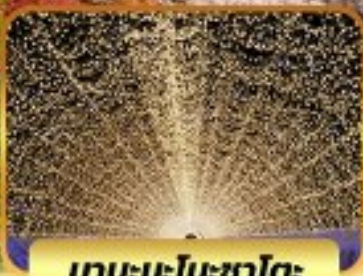
นาบะนะโนะซาโตะ