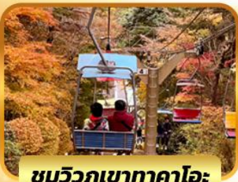
ชมวิวกุเขาทาคาโอะ