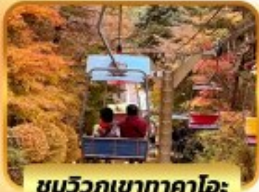
ชมวิวกุเขากาโตะ