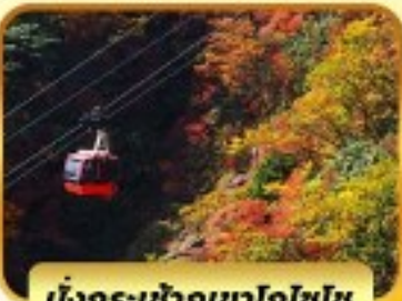
นั่งกระเช้าภูเขาโทโชไซ

ไฮไลท์ พัก 4 ดาว ★★★★★ โอบาระ(ซากุระ) เมืองเกียวโต วัดคิโยมิสึ(วัดน้ำใส) หมู่บ้านชิราคาวาโกะ ถนนชั้นมาชิซุจิ สะพานนาคาบิชิ ซ้อปบิง ชินโซบาชิ ย่านซาคาเอะ อีออน