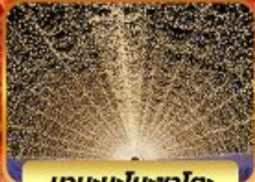
มาบะนะโนะซาโตะ