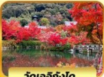
วัดเออิทังโด