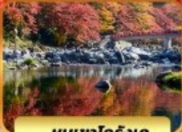
หุบเขาโคริงเค