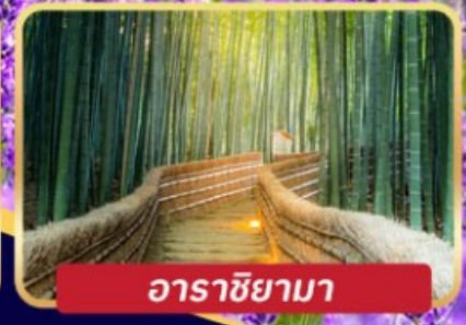
อาราชิยามา