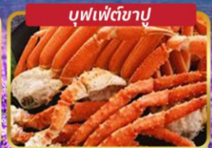
บุฟเฟ่ต์ขาปู