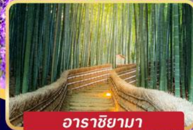
อาราชิยามา