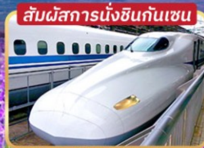
สัมปัสการนั่งชินกันเซน