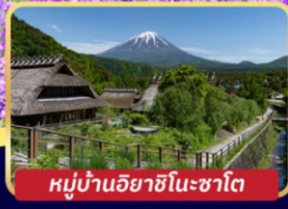
หมู่บ้านอิยาชิโนะซาโต