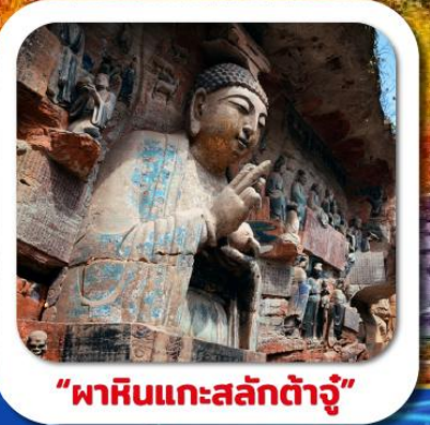
"พาสินแกะสลักต้าจู้"