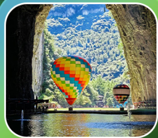
"ถ้าถึงหลง"

เที่ยวจีน 2 มณฑล เสฉวน+หูเป่ย์ (เมืองหลงซิ่ง+เมืองเอินฉือ) • ถ้าถึงหลง ล่องเรือมังกรกังซู่ยชมวิวยามค่ำคืน • ผิงซานแกรนด์แคนยอน (รวมล่องเรือ) หงหยาดัง • วัลหลิวอัน • ถนนคนเดินเจียฟางเป่ย์ • ตึกตะเกียบ