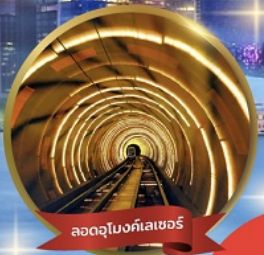
ลอดอุโมงค์เลเซอร์