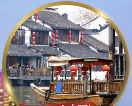
ล่องเรือเมืองโบราณ จูเจียเจียว