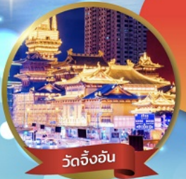
วัดจิ้งจัน