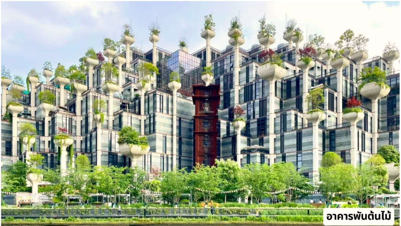
อาคารพันต้นไม้