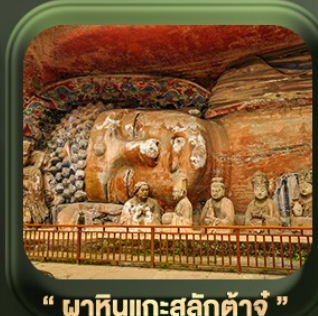
“ พาคินแกะสลักต้าจู้ ”

วันเดินทาง มี.ค. - ต.ค. 2569 ราคาเริ่มต้น 22,999.-