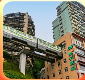
“นั่งรถไฟทะลุติ๊ก”