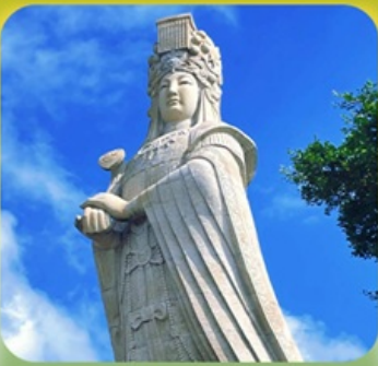
“เจ้าแม่กิมทิมหม่าโจ้ว”