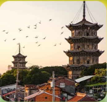
“เมืองโบราณฉวนโจว”