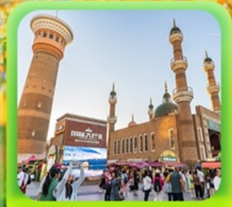
"ตลาดต้าปาจา"

ซินเจียงเหนือ ทะเลสาบไซลีมู่ "น้ำตาหยดสุดท้ายของแอตแลนติก" • ทุ่งหญ้านาราตี ทุ่งดอกไม้เทียนซาน • ผ่านชมสะพานกั๋วจื่อโกว • ถนนหลิวซิงเจียง • ตลาดต้าปาจา