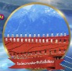
วัดลามะของจ้านหลิน