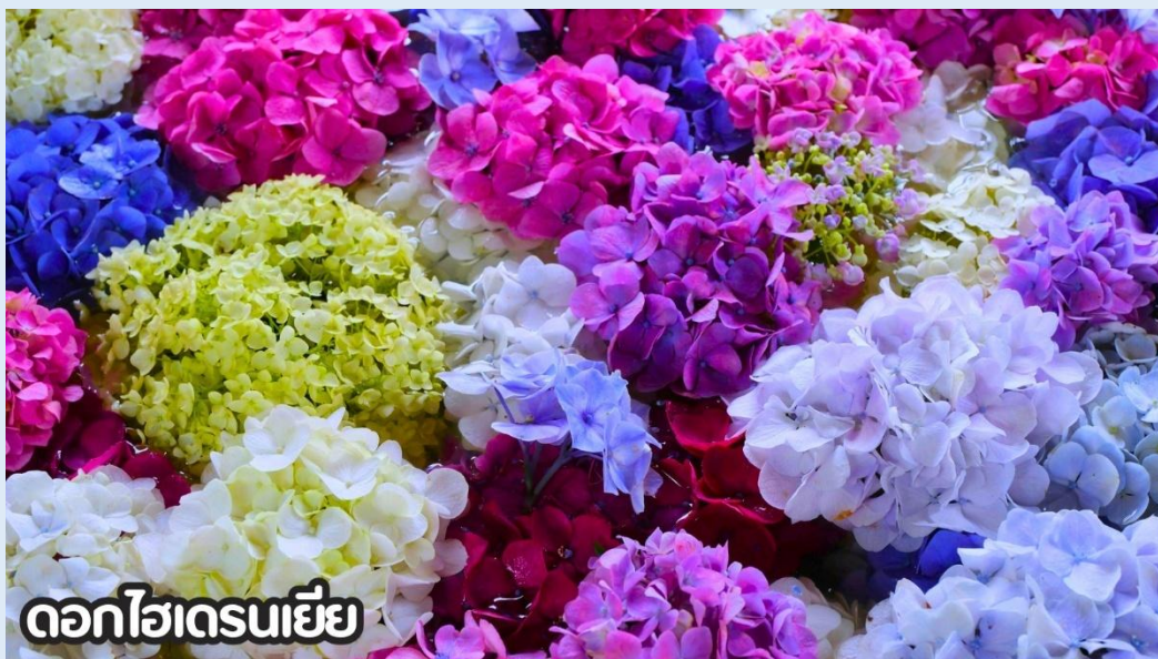
ดอกไฮเดรนเยีย

(ปลายเดือนพฤษภาคม-มิถุนายน): ชมดอกไม้ไฮเดรนเยีย ดอกไฮเดรนเยียที่คุนหมิง ประเทศจีน บานสะพรั่งสวยงามที่สุดในช่วงเดือนมิถุนายน โดยเฉพาะบริเวณทุ่งไฮเดรนเยีย (The Middle Sea Hydrangea Kunming) ซึ่งมีหลากหลายสีทั้งฟ้า ชมพู และม่วง เป็นจุดถ่ายรูปยอดนิยมที่ห้ามพลาด เนื่องจากอากาศที่เย็นสบายและทิวทัศน์ที่งดงาม