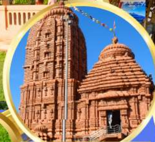
เทวาลัยศรีจักรนารท แห่งดีบุรกาห์