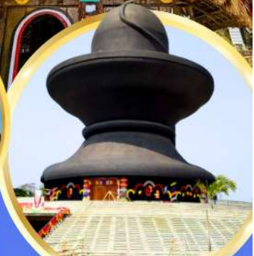
วัดมหาฤตยูชัย