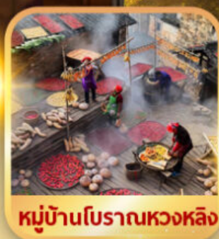
หมู่บ้านโบราณหวงหลิง