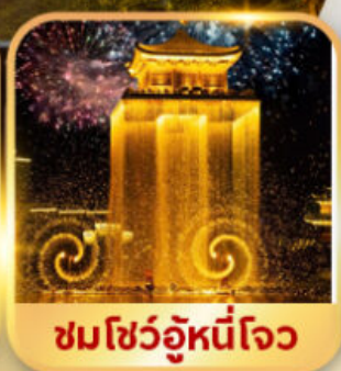
ชมโชว์อุหนี่โจว