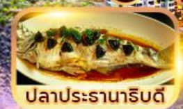
ปลาประจําถิ่นดี