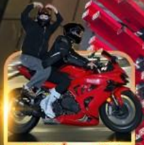
ถ่ายวีดีโอน้องมอเตอร์ไซค์

ชิมหม้อไฟหม่าล่า นั่งรถรางชมธรรมชาติ หวาดเสียวระเบี่ยงแก้ว