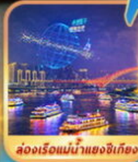
ล่องเรือแม่น้ำแยงซีเกียง