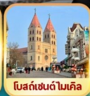
โบสถ์เซ็นต์ไมเคิล