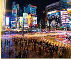
ซีเหมินติง