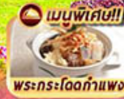
เมนูพิเศษ!! พระกระโดดกำแพง