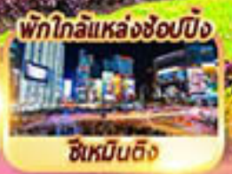
พักใกล้แหล่งช้อปปิ้ง ซิเหมินตง